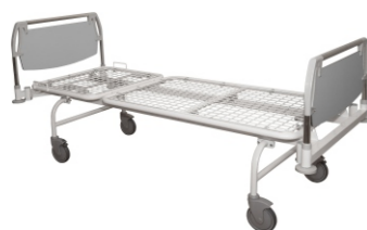
3932, 3934 Серый