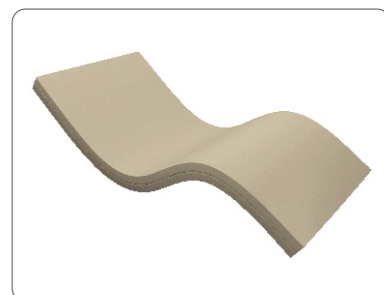
Матрац в чехле из винилскожи