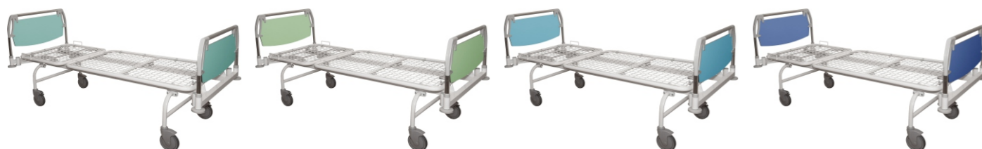
1023/6 Светло бирюзовый