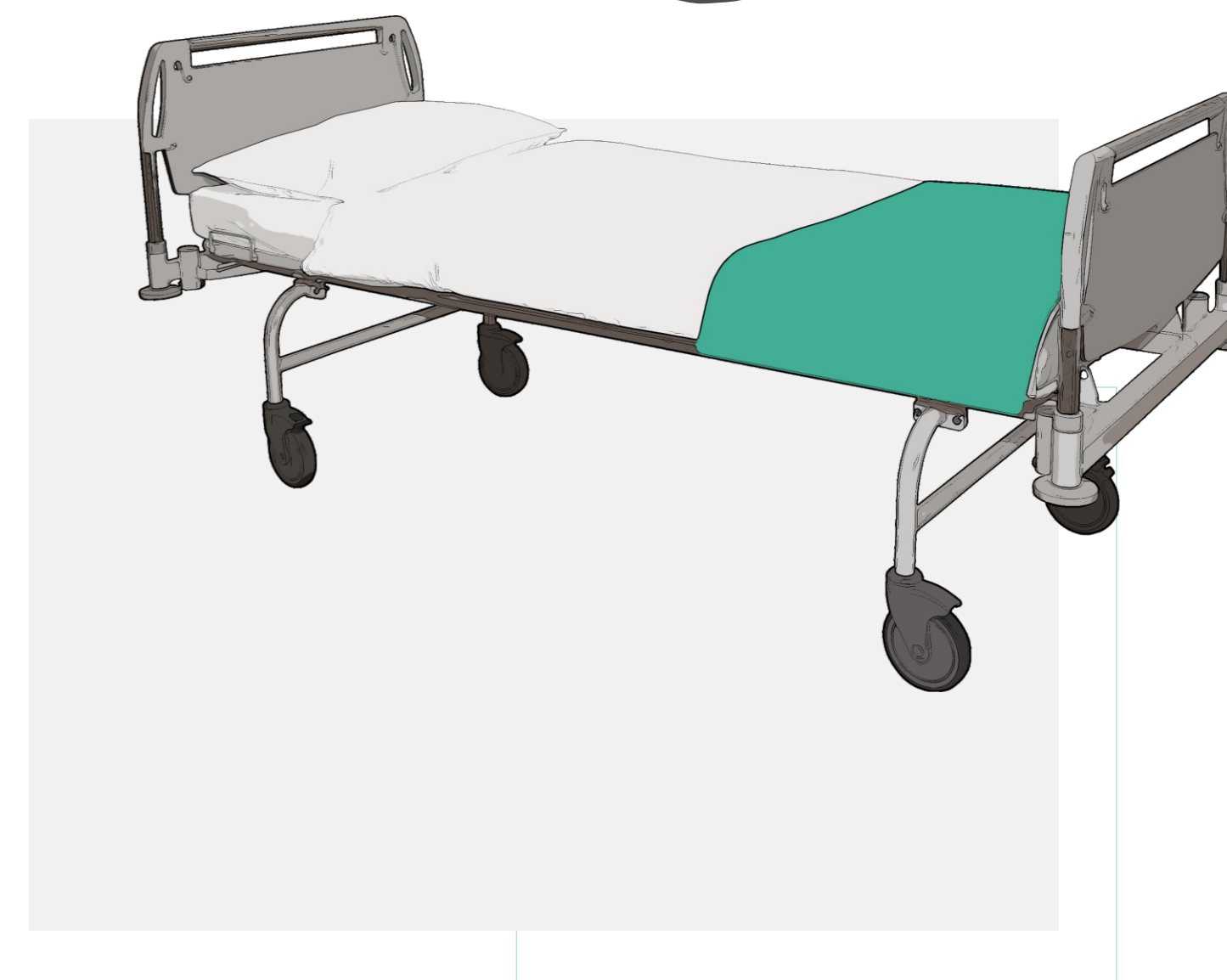
Кровати медицинские многофункциональные механические К-ДЗМО-1-2-Р, К-ДЗМО-1-2-В, К-ДЗМО-1-2-Г