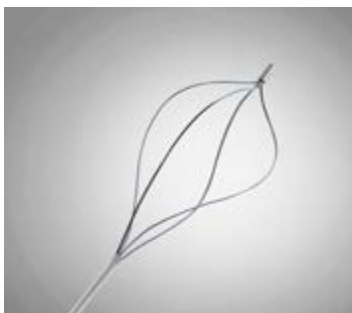
Спиралевидные нити, с наконечником